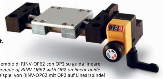
Esempio di RINV-OP62 con OP2 su guida lineare Example of RINV-OP62 with OP2 on linear guide Beispiel von RINV-OP62 mit OP2 auf Linearspindel